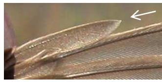
Ad (10ª P)