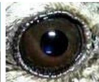
Juvenil (Iris, Lengua, Paladar)