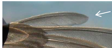
Juvenil (10ª P)