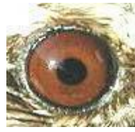
Ad (Iris, Lengua, Paladar)