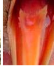
2A (Iris, Lengua, Paladar)