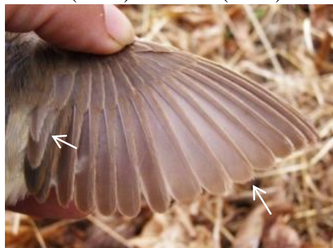
Desgaste Ad en Otoño