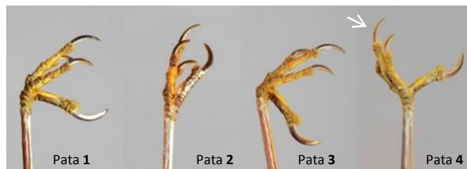
Nivel de aclaración de las patas con la edad